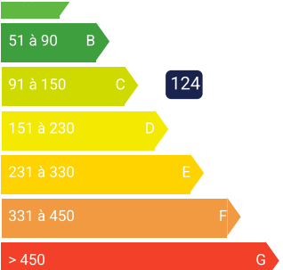
Alloggiamento ad alto consumo energetico kWhEP/m 2 .in